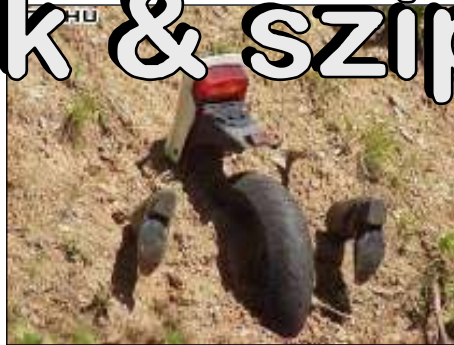
Ő nem a berceli Motoros Baráti Kör tagja.

- Apu, téged megvert valaha az anyukád? - Nem, csak a tied.