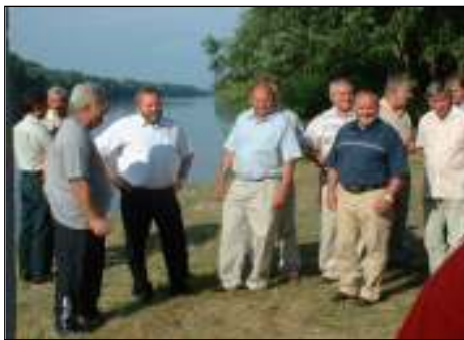
A sajtó és a támogatók a helyszínen. Biznak Bercelben.

Mára eddig még nem tapasztalt számú előzetesen nevező versenyzőnk van, így könnyen elképzelhető, hogy a későn ébredők kimaradnak a versenyből. Az elmúlt évben a versenyt