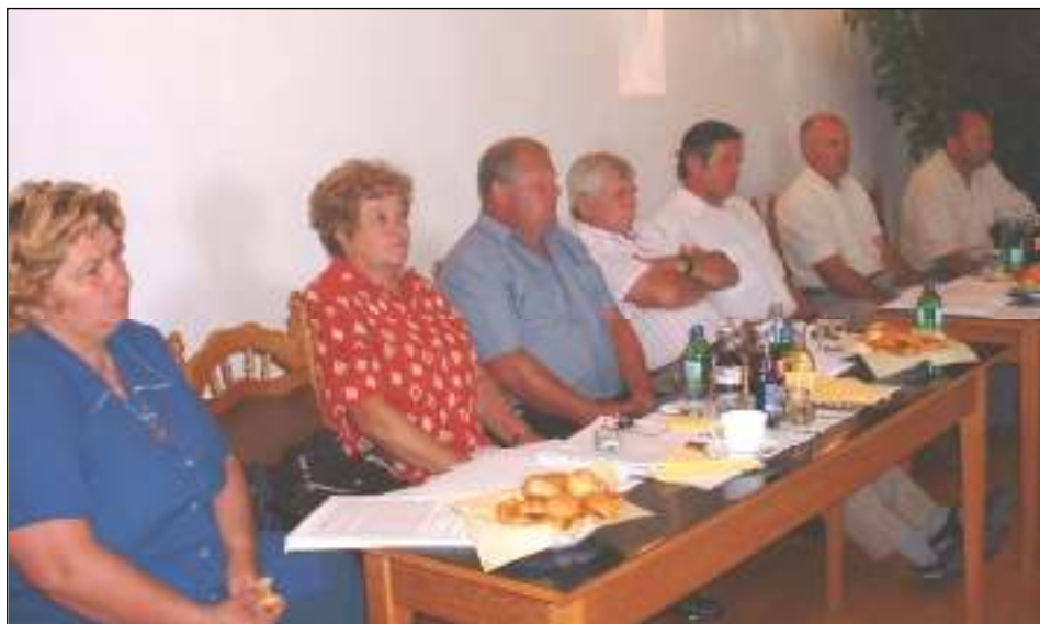
A képviselők az idén is meghallgatták az intézmények és civil szervezetek beszámolóit.

A Tiszabercelért Egyesület korábbi szokásainak megfelelően a rendezvények ideje alatt tartja közgyűlését. A Gátivásár és a Film a gáton események közé, - tehát augusztus 1-jén (vasárnap) - ékelt közgyűlésre 17.00 órától kerül sor a Tisza-parton. Természetesen korábbi hagyományainkhoz híven, valamennyi jelenlévő tagunkat egy tányér ízletes Berczeli halászlével vendégelünk meg. Minden egyesületi tagot ez úton is tisztelettel hív és vár az egyesület elnöksége.