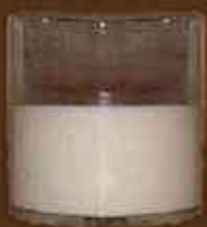
Félig üres pohár