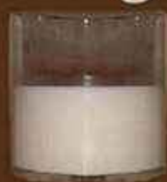
A szükségesnél kétszer nagyobb pohár