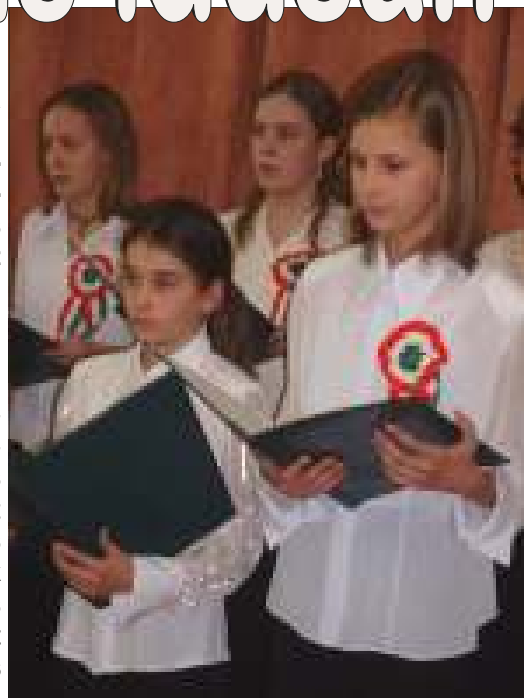
A Bessenyei György Általános Művelődési Központ diákjai ünnepi műsorával kezdődött az 1848-49-es Forradalom és Szabadságharcra való megemlékezés