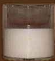
Félig teli pohár