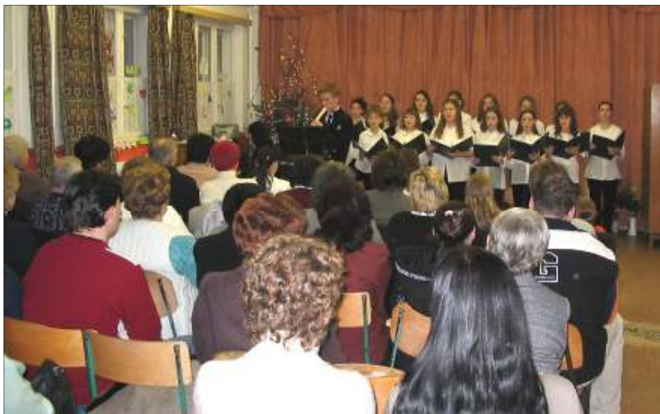
A karácsonyi koncertet előadó művészeti gyerekek, a termet megtöltő hallgatóság.