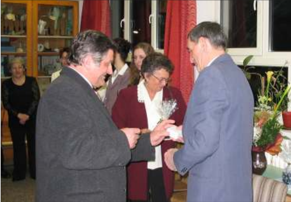
A búcsú egy pillanata.