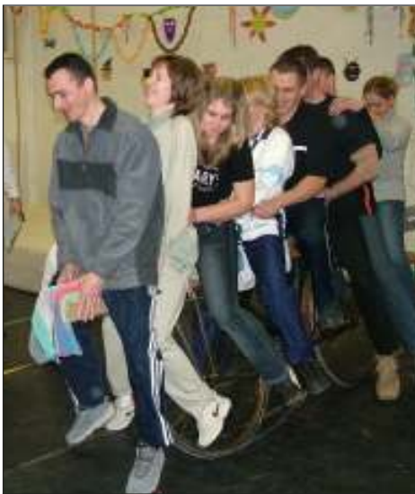
Bicajozni így is lehet ...