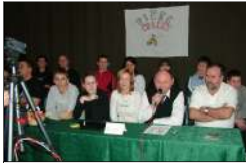
Pipec Csapat Pipec nélkül. Ő a kamera másik oldalán állt.