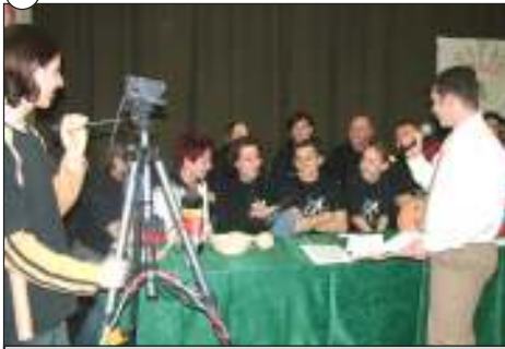
BIKE: Biztos Irigykedést Kiváltó Egyesület.