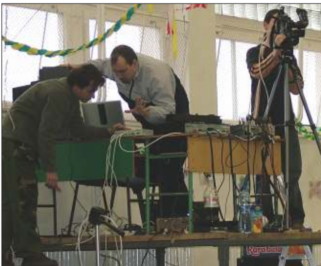
Kábelrengeteg. Vagy rengeteg kábel? A stáb hasonlóan a műsor szervezőihez közel 2 hónapig készült a felvételre.