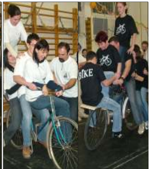
... meg így is .