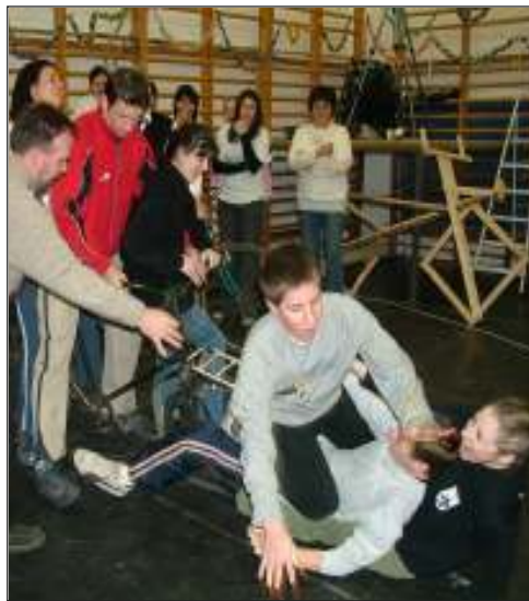
... meg így is ...