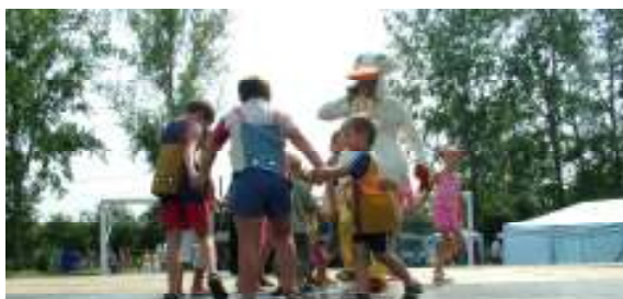
A gyerekeket Dodó kacsá szórakoztatta