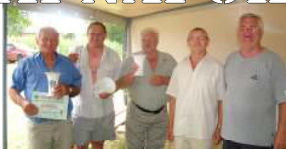
Az ulli bajnok bercséli csapat

megcsináltuk árral szemben borúra derű füst szállt a szemünkbe Az összefogás ereje téglagyári capricco volt és lesz