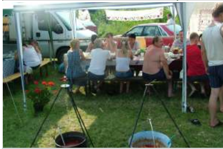
Életkép a versenyzőkről, 31 bográcsban főtt a halászlé