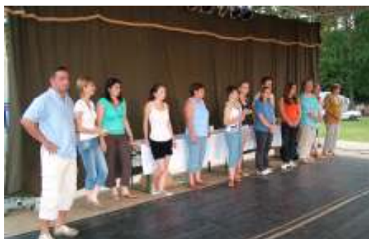
A Rétközi ifjúsági és sporttalálkozó szervezői