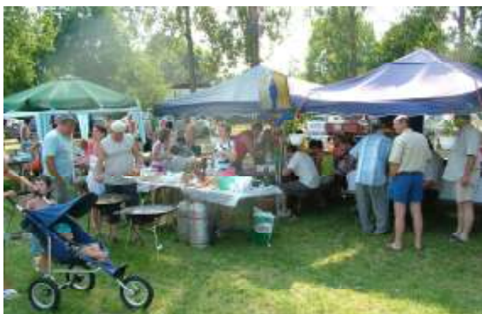
32 csapat közel 900 fővel képviseltette magát