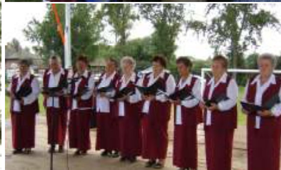
A házigazda Tiszaberceli Nyugdíjas Egyesület mindenkit lenyűgöző műsort adott