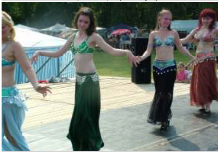
A IX. Felső- Tiszai Halászléfőző fesztivál hastáncosai