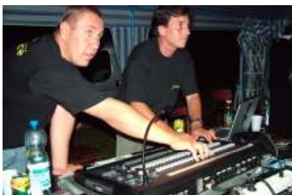
Profi technikusok munka közben