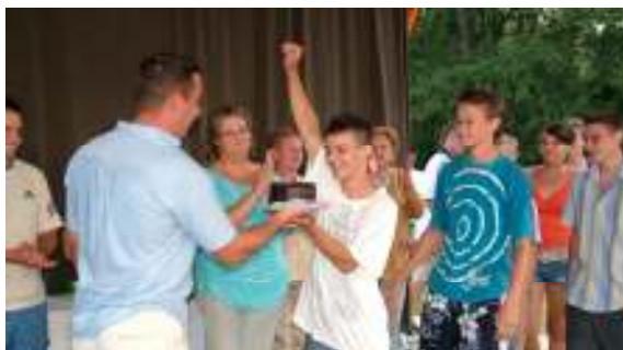
BIKE- A Rétközi ifjúsági és sporttalálkozó díjátadója