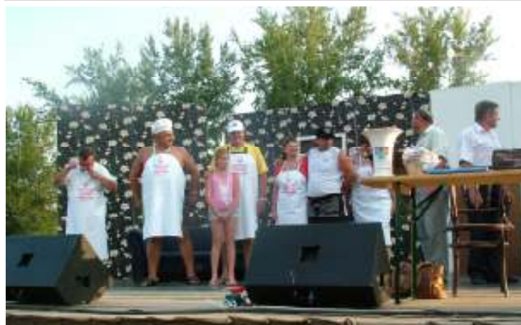
A 100.000,- Ft-os főnyereményt ibrányi csapat nyerte