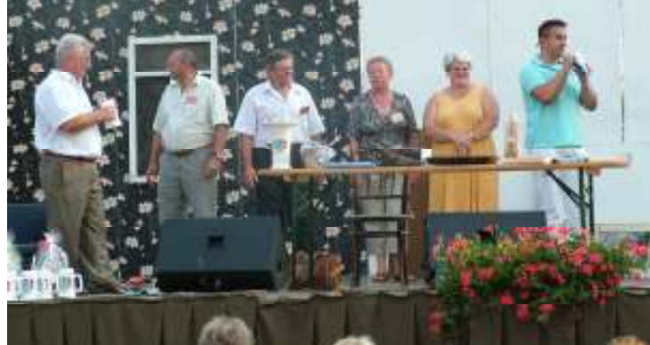
A IX. Felső- Tiszai Halászléfőző fesztivál eredményhirdetése