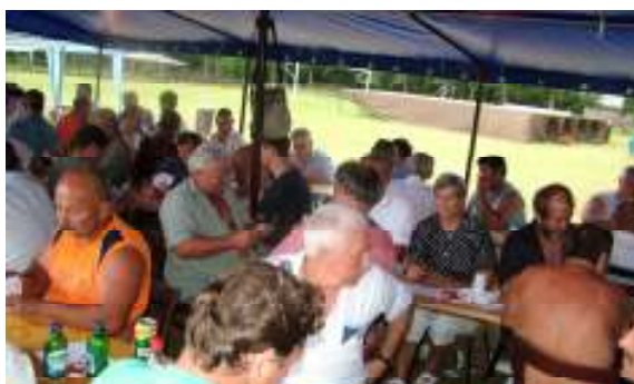
IX. Tisza-parti Ulli-party