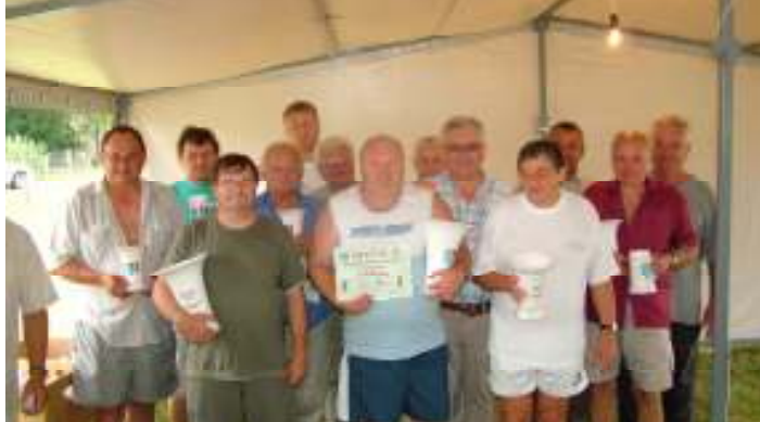
A IX. Tisza-parti Ul'ti-party boldog díjazottai