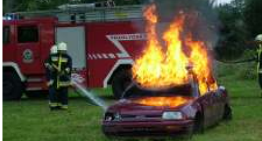
Így járt, aki tilosban parkolt