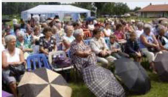
Az eső enyhítette a forróságot, de a jókedvet nem zavarta