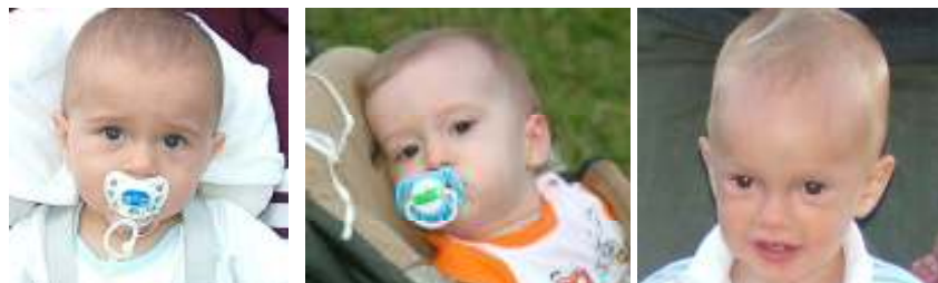
Az ifjúsági-és sporttalálkozó „babatagozata”