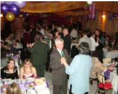
IV. egyházi bál