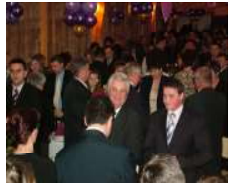
IV. egyházi bál