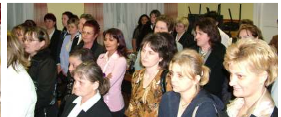
A szociális ápoló és gondozó tanfolyam boldog végzősei