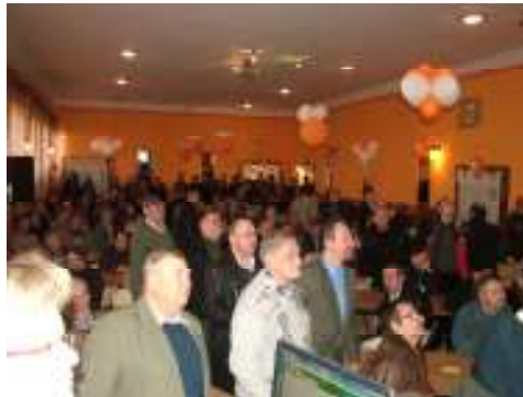
Az Ultibajnokság nevezői