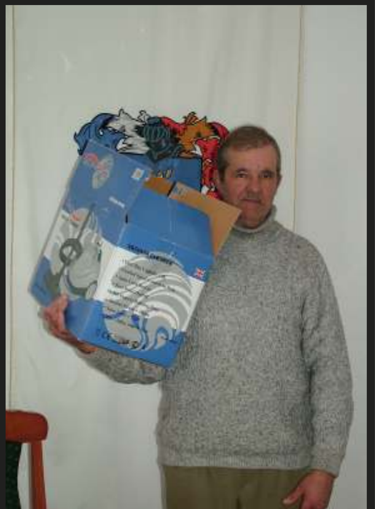
NÉMETH SÁNDOR (1950–2008)