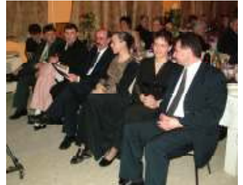
IV. egyházi bál