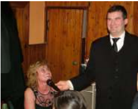
IV. egyházi bál