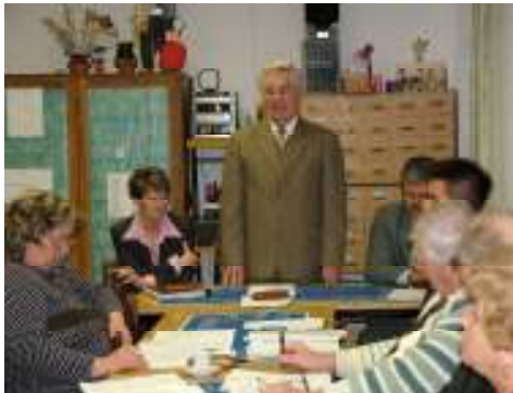
Képviselő-testületi ülés a könyvtárban