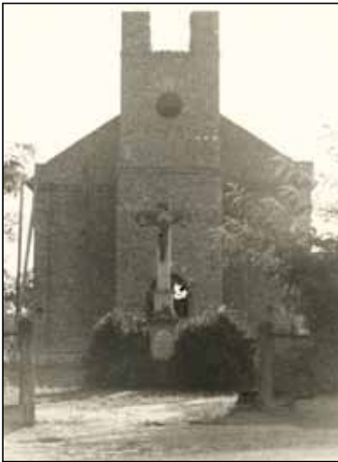
A háború után újjáépülő templom

Tavaly októberben a római katolikus templom kertjében – az új kereszt állítása előtt az építők - földre döntötték a közel száz esztendősi templomi keresztet. A hatalmas kötőanyag hosszú napokig a földön hevert, számomra az elmúlt évszázadot jelképezte.