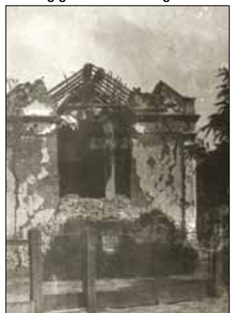
A felrobbantott templom képe az épen maradt keresztrel (1944)