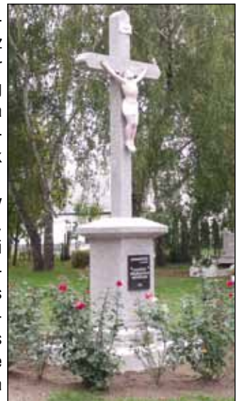
A új márvány kereszt a régi korpuszsal