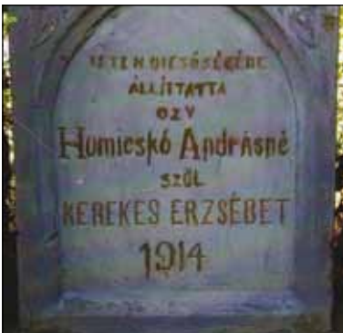
A egykori kereszt felirata

ezek az alkotások kétséget kizárólag több közös vonást is magukon viselnek. A hasonlóság egyik szép példája az állítás oka. Szinte kivétel nélkül hálából, odaszánásból, fogadalomból, adományból történt.