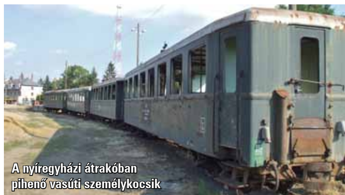
A nyíregyházi átrakóban pihenő vasúti személykocsik