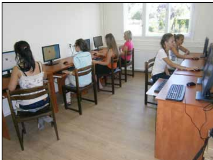
A könyvtár új, számítógépekkel felszerelt olvasóterme

Ezzel a projekttel a korábbi Teleház kiesett funkciója kerül részben pótlásra, de a jövőben bármelyik lakosnak lehetősége lesz kulturált környezetben internet és számítógép igénybevételére. Az igénybevétel rendjéről a képviselő-testület még nem rendelkezett, de hamarosan ez is szabályozásra kerül.