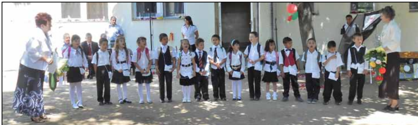
A ballagó nagycsoportosok

„Vár a tudás palotája, vár engem az iskola, szeptembertől megyek oda, viszlát Kedves Óvoda.”