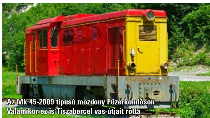
Az Mk 45-2009 típusú mozdony Füzerkomlóson Valamikor ez is Tiszabercel vas-útjait rőtta