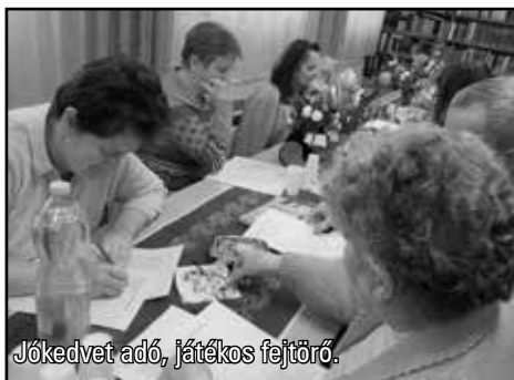
Jókedvet adó, játékos fejtörő.