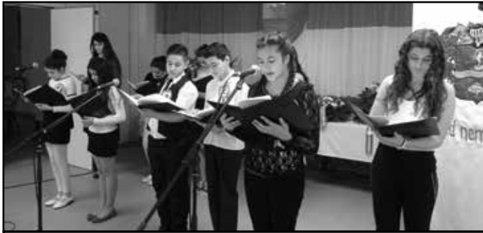
Március 15-én iskolánk tanulói is szerepeltek az 1848-49-es forradalom és szabadságharc tiszteletére rendezett ünnepségen.

Iskolánk irodalomszerető diákjai január 23-án a magyar kultúra napja alkalmából rádióműsorban emlékeztek a magyar kulturális értékekre, hagyományokra, a magyar Himnusra és a magyar nyelvre.