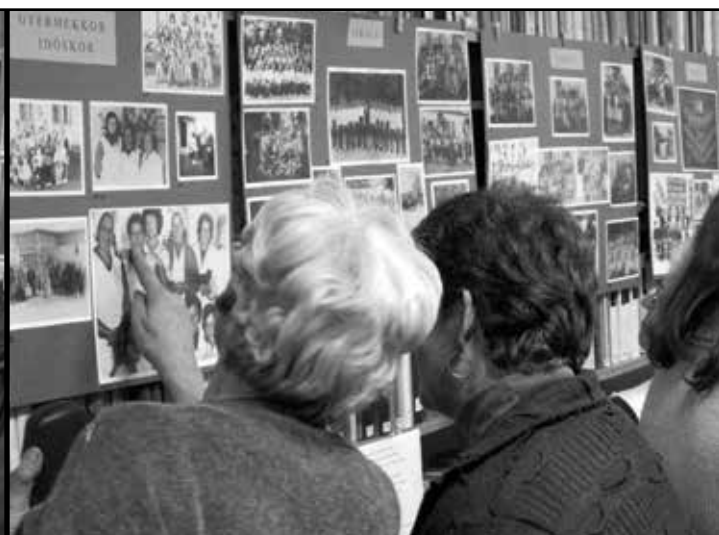
A képanyag egész februárban nyitott volt könyvtári látogatóink előtt.