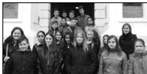
A Debreceni Református Kollégium Gimnáziuma minden év tavaszán megnyitja kapuit. Április 22-én a Kollégium és Debrecen nevezetességeinek megtekintésén túl, több szabadtéri program várta a Tiszántúli Református Egyházkerület gyülekezeteinek konfirmandus csoportjait.