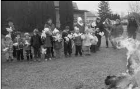
Másnap méltó módon búcsúztattuk el a telet s vártuk a jó időt.

Végezetül szeretnék köszönetet mondani mindazoknak, akik segítségükkel, adományaikkal, bármilyen formában hozzájárultak minden egyes rendezvényünkhöz, hogy sikerebb, emlékezetesebb, szórakoztatóbb lehetett gyermek és felnőtt számára egyaránt.