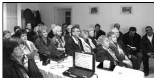
A buji református gyülekezettel közös, böjt előtti bűnbánati alkalom.