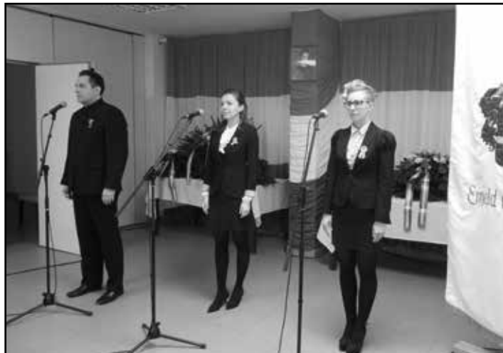
Nemzeti ünnepünk községi megemlékezését a KSZR támogatásával a Mandala Dalszínház tagjainak lélekemelő műsora tette feledhetetlenné.