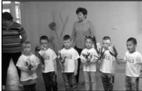
Május első napjaiban nagy szeretettel köszöntöttük az édesanyákat, nagymamákat anyák napja alkalmából.