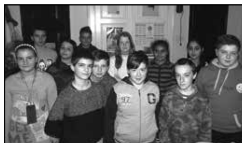
A hitbéli megerősítést célzó felkészülési időszak május 14-én sikeres vizsgával zárult.