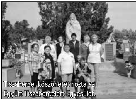
Tiszabercel köszönetét hozta az Együtt Tiszabercelért Egyesület.