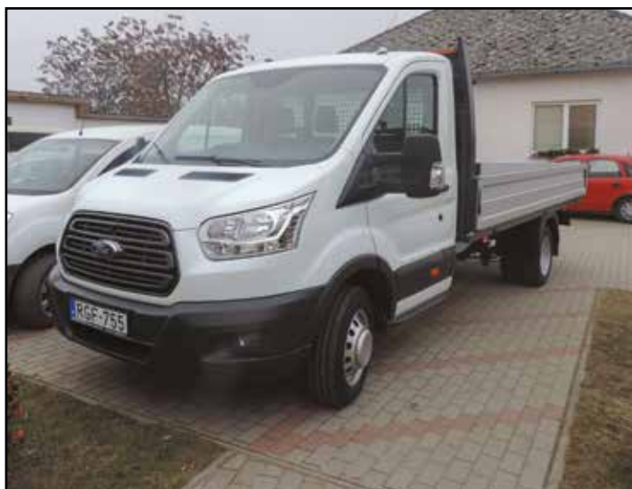
A Belügyminisztérium többlettámogatásaként nyújtott forrásból vásárolt kisteherautó

A fejlesztés a Szabolcs-Szatmár-Bereg Megyei Önkormányzati Hivatallal konzorciumban valósult meg.