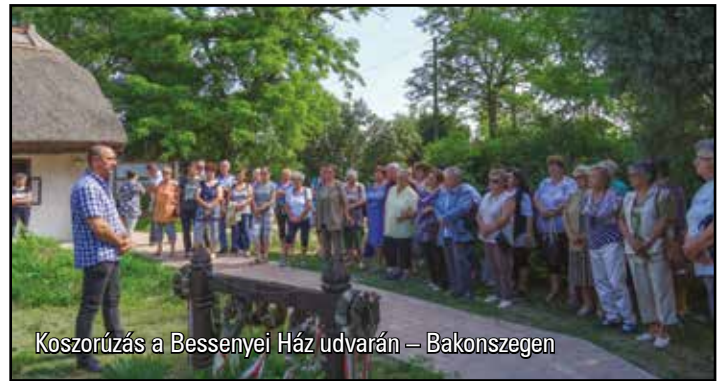
Koszorúzás a Bessenyei Ház udvarán – Bakonszegen