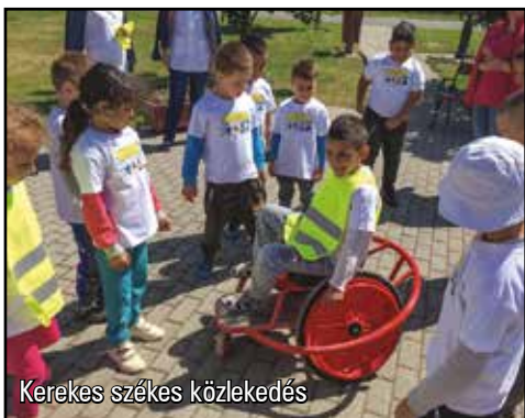
Kerekes székes közlekedés