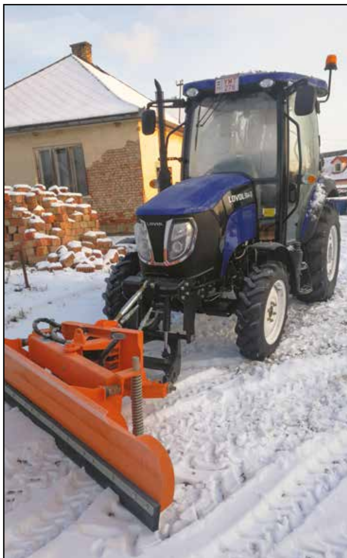
Üzembe állt új traktor a hótolóval