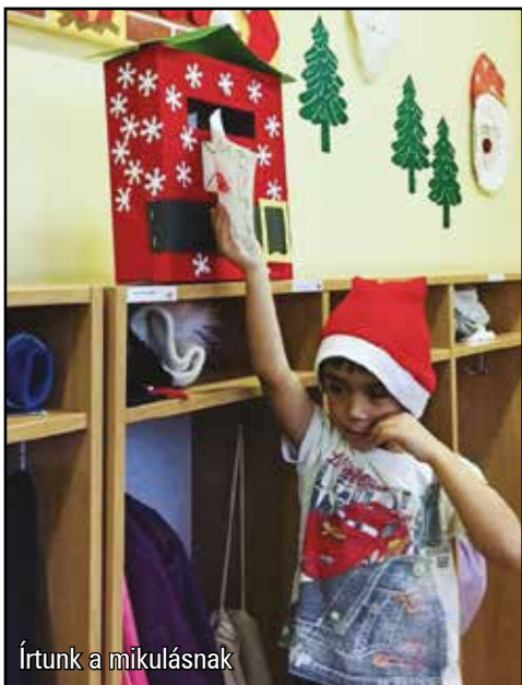
Írtunk a mikulásnak