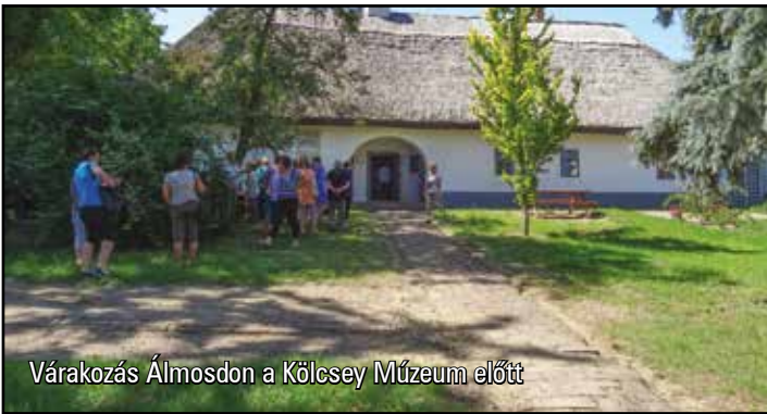
Várakozás Álmosdon a Kölcsey Múzeum előtt

zsuppfedeles Bessenyei ház / azóta már elkészült/. Megkoszorúztuk a nagy író szobrát, és elsétáltunk a Berettyó-partján álló „Obeliszkhöz”. A község ápolt parkjában a Nadányi Miskolci Udvarház ámulatba ejtett bennünket. Óriási közgyűjteménye, annak gondozása, a kertben létesített „Kostemető” egyedi, országos hely.