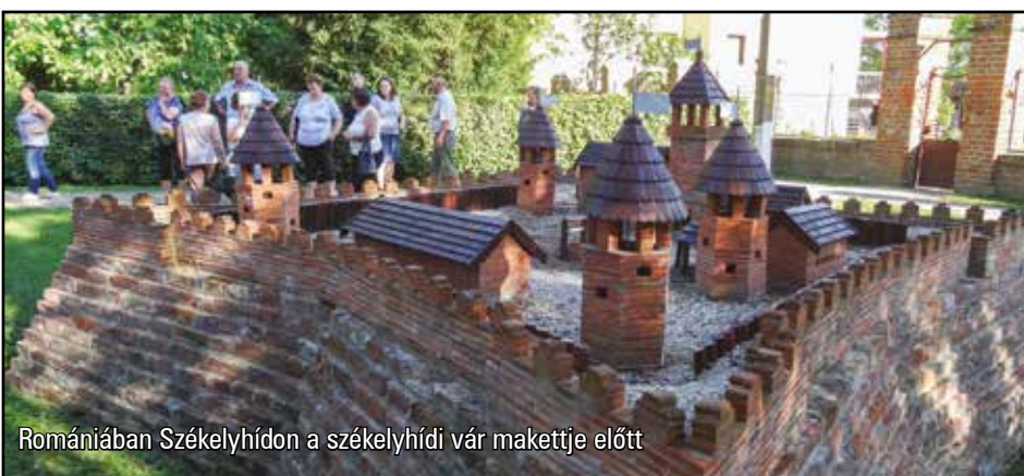
Romániában Székelyhídon a székelyhídi vár makettje előtt

Álmosdra igyekeztünk, „ Bocskai” falujának is nevezik, hiszen 1604. október 15-én Álmosd határában arattak Bocskai István hajdú Basta császári tábornok serege felett. Álmosd nevezetessége a Kölcsey Ferenc Emlékház. 1812-1815 között élt és alkotott Himnuszunk írója, és gyermekkorában is 6 évet töltött e falak között. A kokadi étteremben ebédeltünk. Az ebédünket a velünk utazó református tiszteletes, illetve a református presbitérium fizette pályázati pénzből. A nap tetőzéseként Romániában, Székelyhídon kötöttünk ki. A református templom parkjában áll a székelyhídi vár makettje.