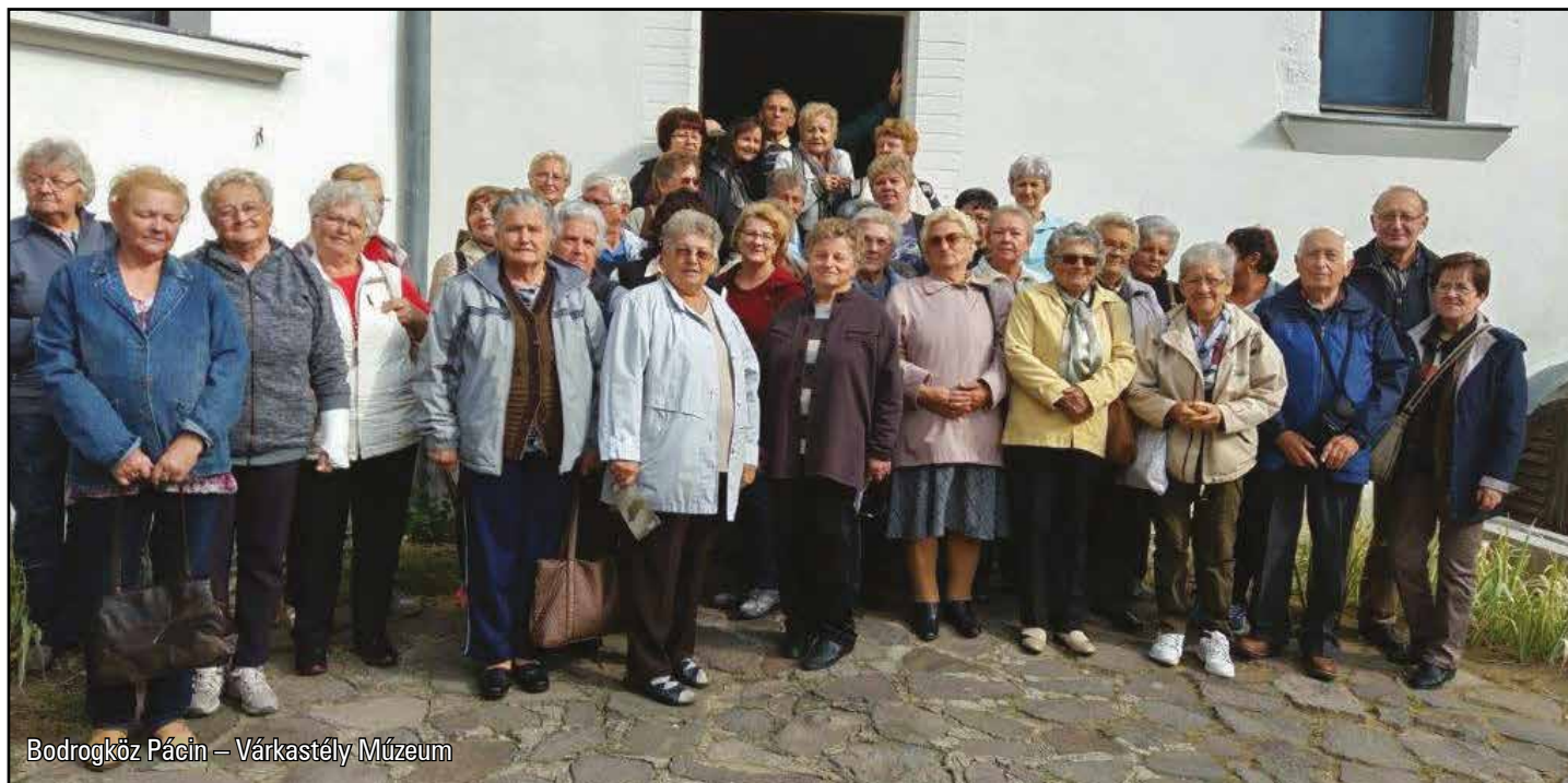
Bodrogköz Pácin – Várkastély Múzeum

Jelenleg karácsonyra készülünk, ahol köszöntjük az 50. házassági évfordulót ünneplő tagtárs házaspárunkat, valamint az úgymond kerek évfordulót ünneplő születésnaposokat.