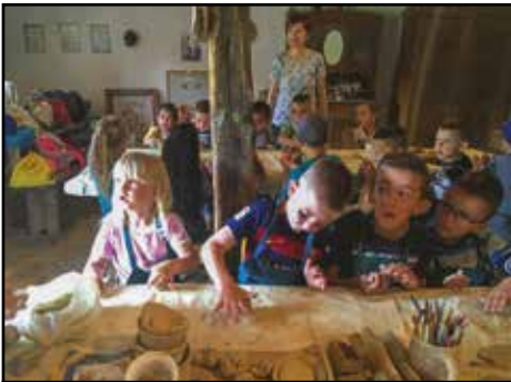
Agyagozás a falumúzeumban

tésével. Az elsajátított táncokat, játékokat a gyerekek szüleinek és a község lakosainak is bemutatták. A program lehetőséget biztosított a szabadidő hasznos eltöltésére. A tevékenységeket színesítette futóverseny a húsvéti tojás keresés, sárgatúró készítés. Az idősek házában írókázni is tanultak a gyerekek. Óvodás gyermekeink két kiránduláson vettek részt. Ellátogattak a nyíregyházi állatkertbe és a falu múzeumba ahol agyagoztak és népi játszóházi verseny játékokon vehettek részt.