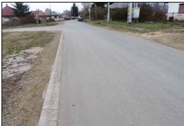
Vásártér utca felújított szakasza