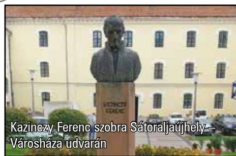
Kazinczy Ferenc szobra Sátoraljaújhely – Városháza udvarán

Ebéd Károlyfalván, a szépséges környezetben lévő kis svábfaluban volt, majd Tokajban zártuk a napot jó hangulatban.