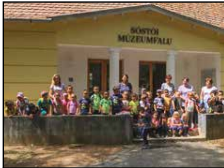
A falumúzeum bejáratánál